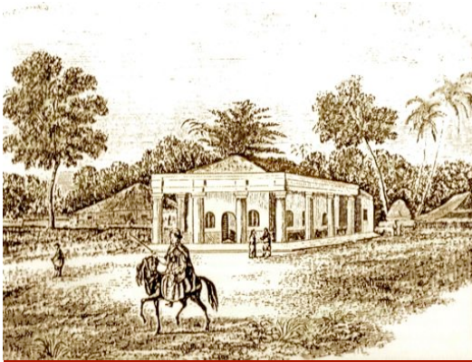
Gedung pertama tahun 1833 PARAPATTAN ORPHAN ASYLUM.